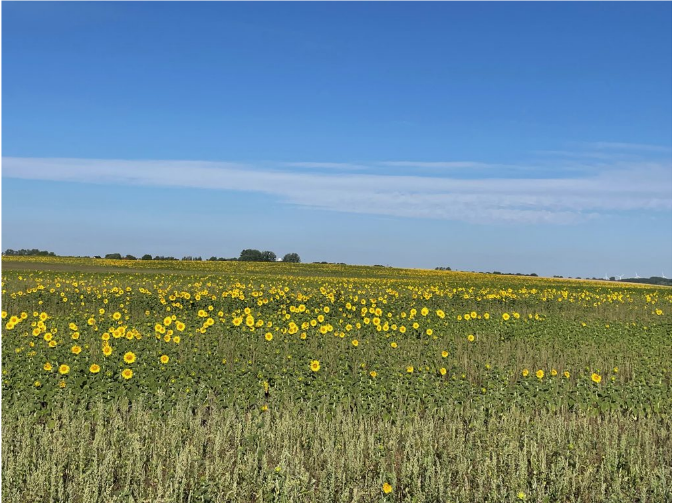
Sonnenblumenfelder bei Zehdenick

In Zehdenick stieß ich dann auch auf den Voßkanal, dem ich auf dem Radweg auf dem Damm lange Zeit folgte. In der Nähe von Wasser macht Radfahren mir immer doppelt Spaß und ich genoß diesen Abschnitt sehr ... auch, weil es ein gut ausgebauter, großteils geteilter Radweg war und ich gut Strecke machen konnte. Die Temperaturen stiegen allerdings schon recht schnell am Vormittag in die hohen 20er, sodaß ich einige Pausen einlegen musste um Flüssigkeit und Energie nachzutanken.