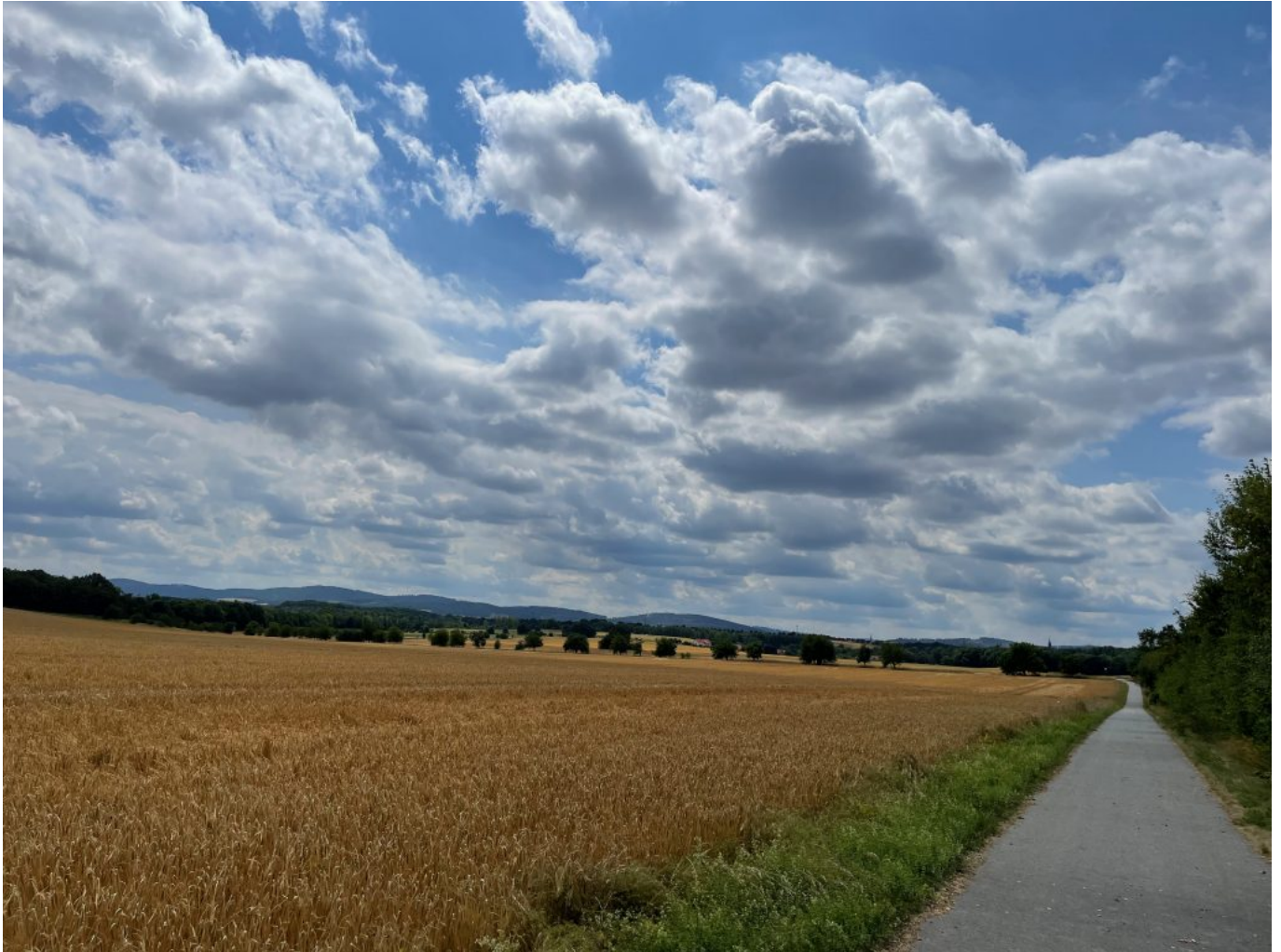
kurz vor Bautzen