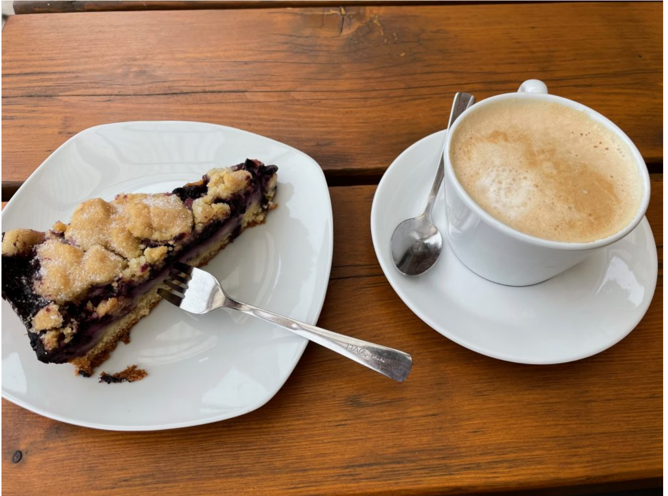
Stärkung im Burgcafé