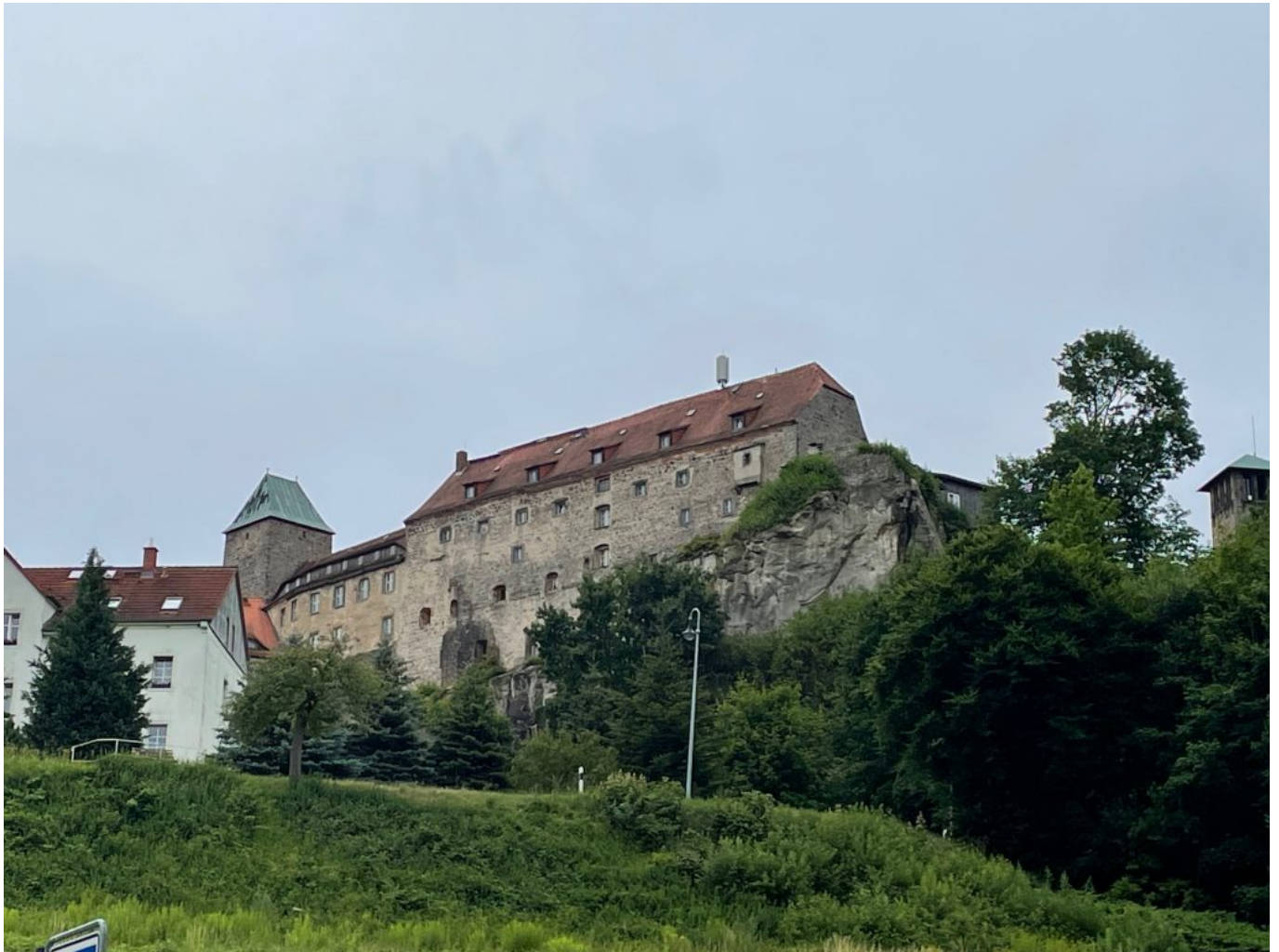
Blick zurück bei der Abfahrt