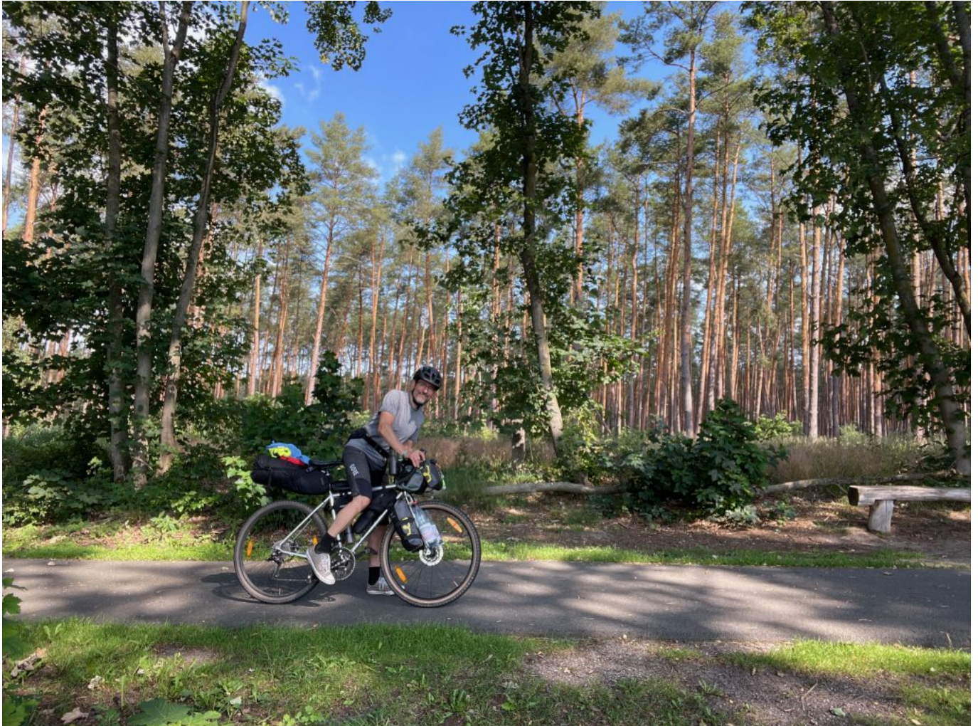
Der Spreeradweg ...