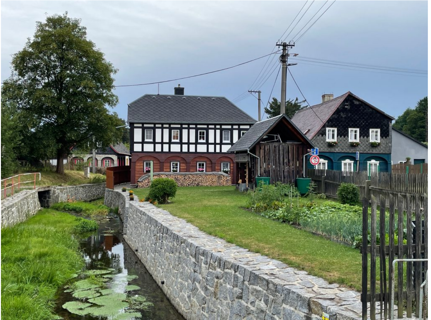
Šluknov im Morgenlicht