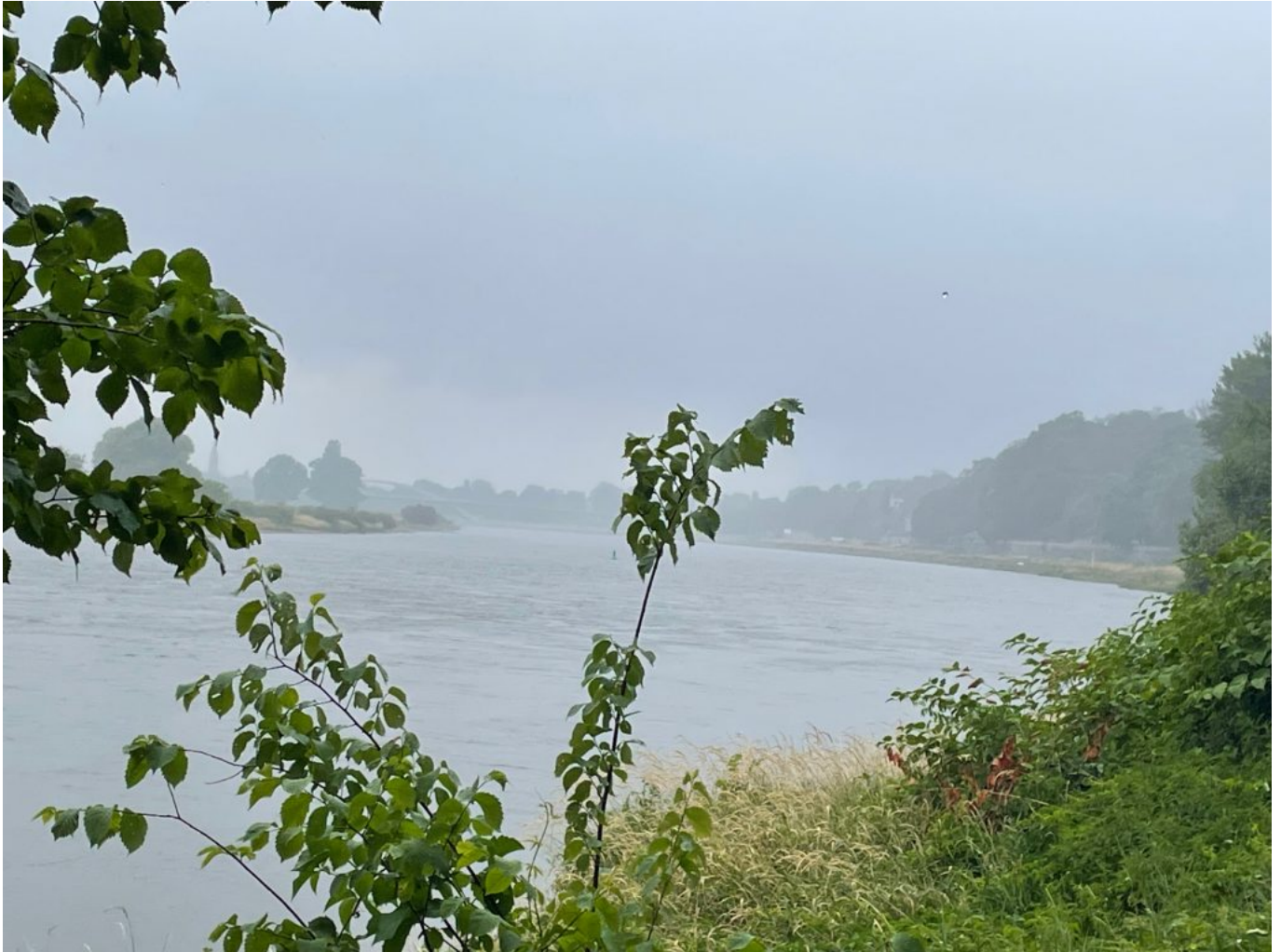
ordentlicher Regenguss kurz vor Dresden