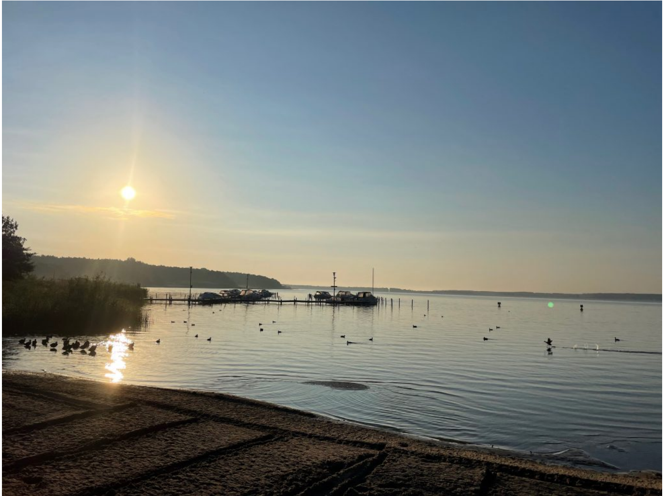
Sonnenaufgang über dem Fleesensee