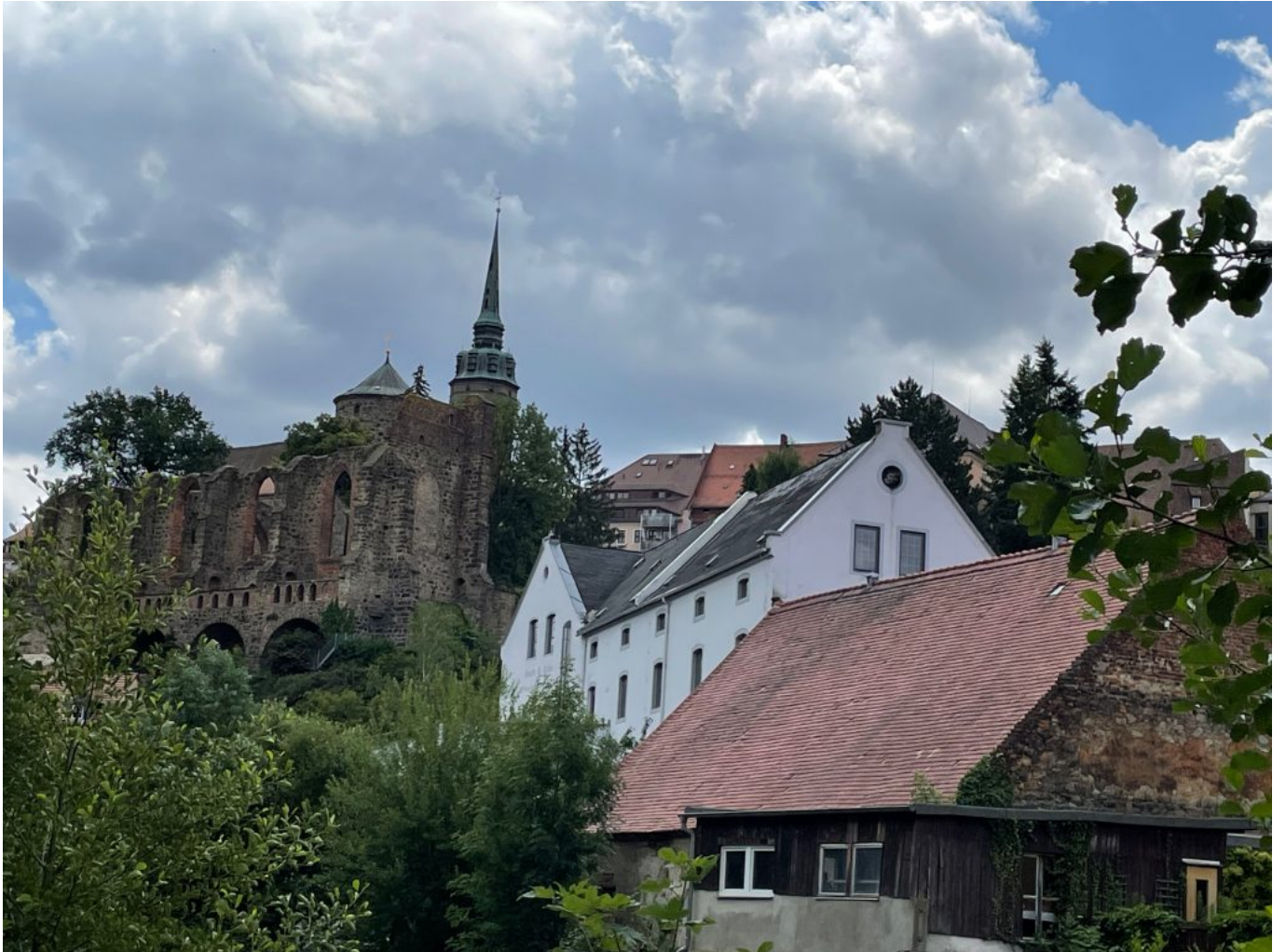
Blick von Seidau zur Altstadt Bautzen