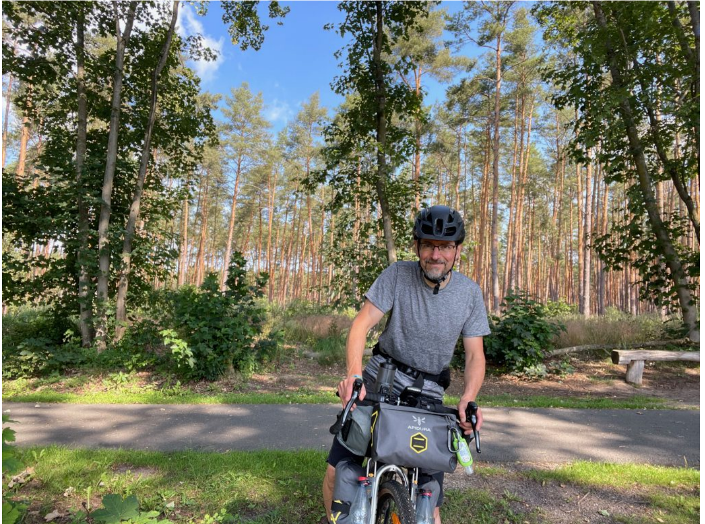
...ist gut ausgebaut ...