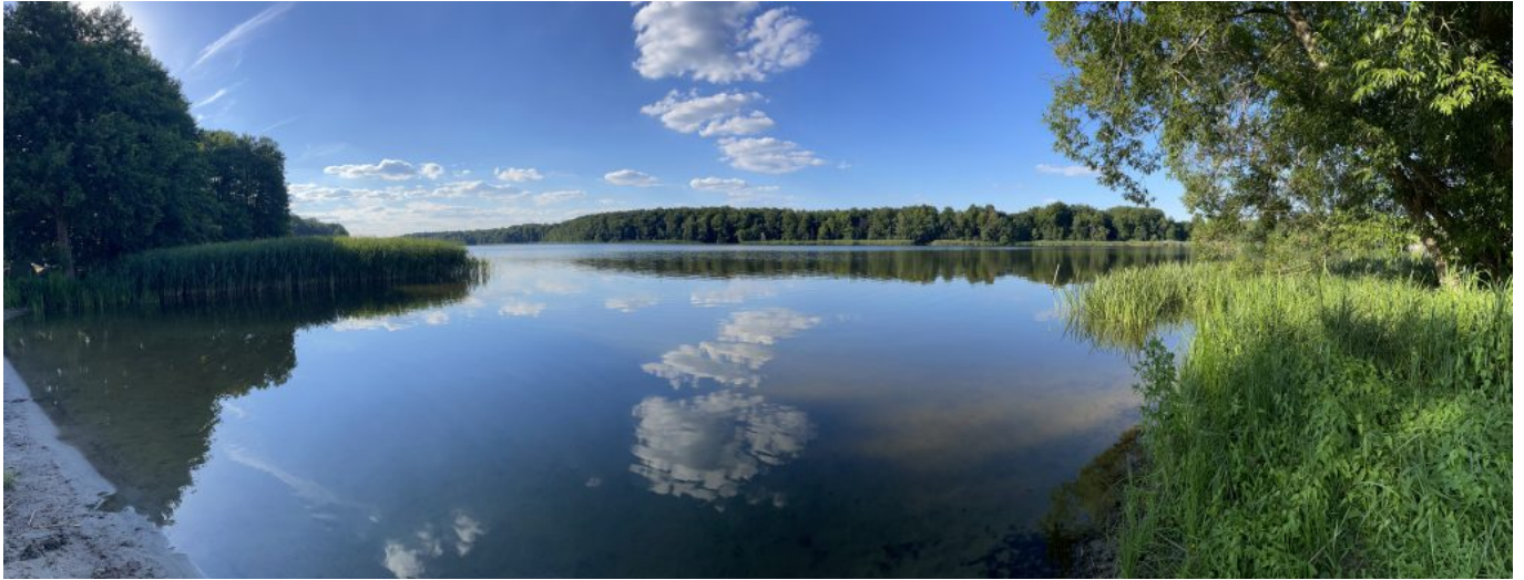
Blick auf den Kleinen Wentowsee