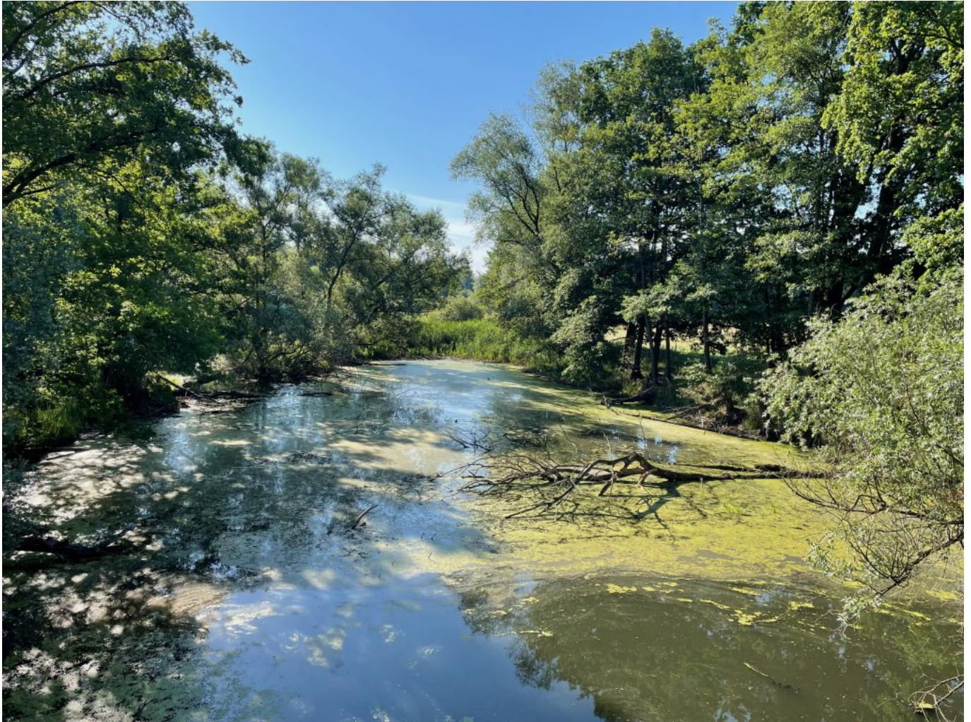
Die Route ging immer wieder zur Spree zurück