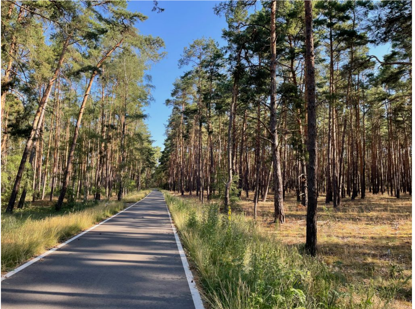
durch schöne Landschaften