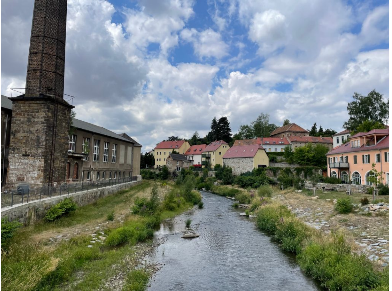
Bautzen - Seidau