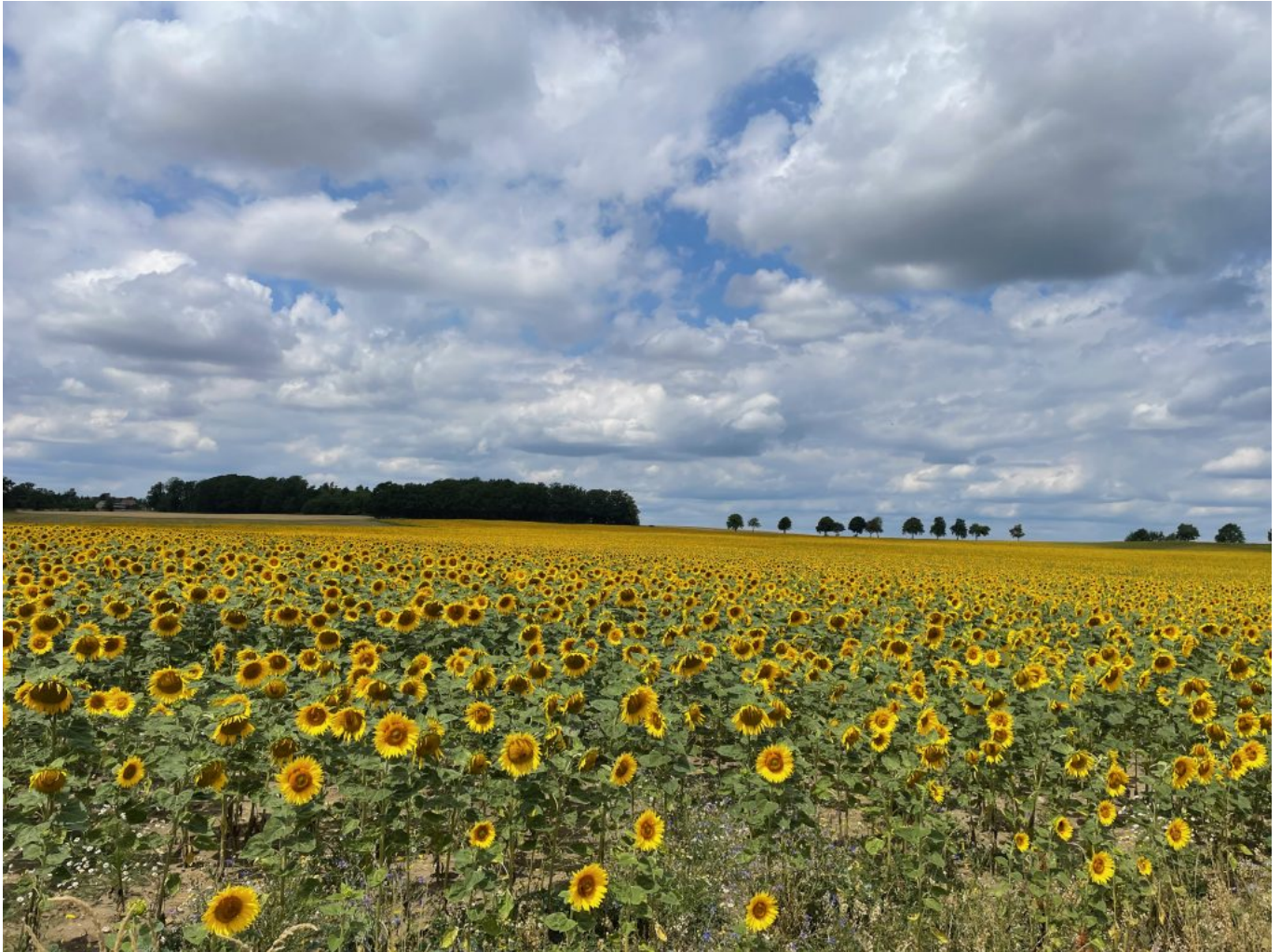
Sonnenblumenfelder bei Dahlowitz