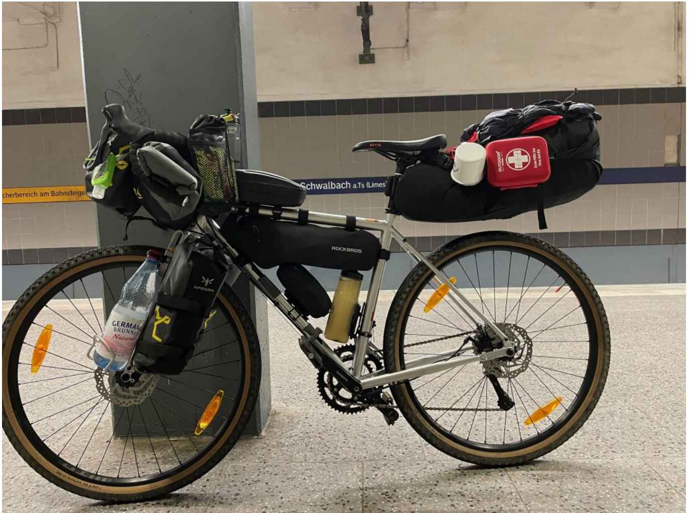
Am Bahnsteig in Schwalbach a.Ts.