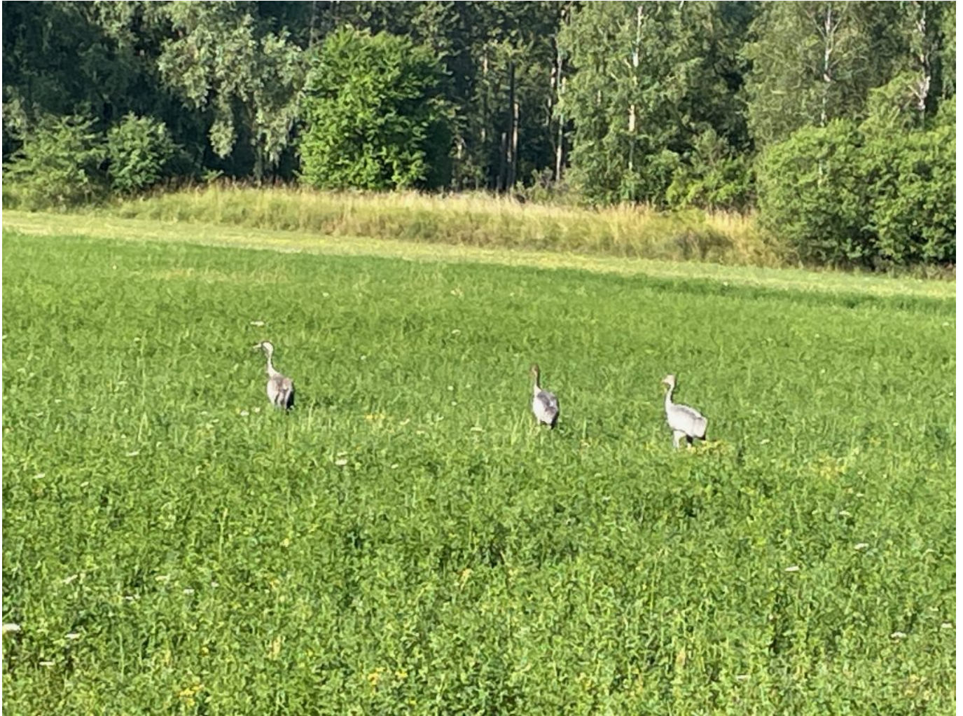
Kraniche am Morgen