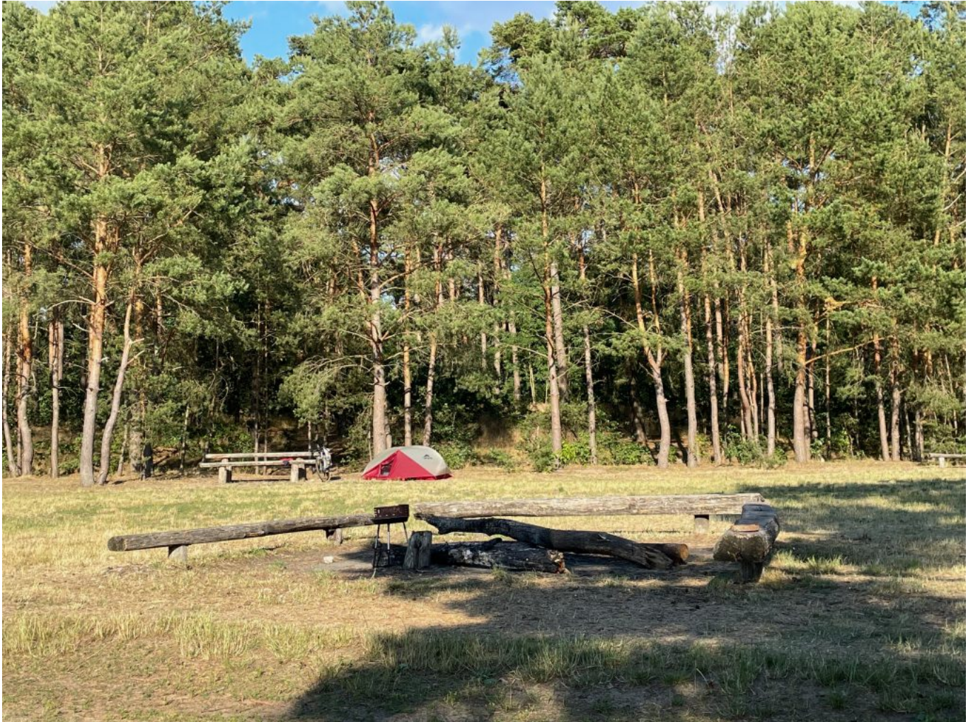
Am Wasserwanderrastplatz Mönchwinkel

Die folgende Nacht war leider nicht wirklich erholsam. Ich schlafe grundsätzlich schon recht unruhig alleine im Zelt, aber diesmal hatte ich dummerweise meinen Müll im Beutel an den Lenker gebunden. Das Fahrrad lehnte an einem Holztisch direkt neben dem Zelt. Da es so warm war, hatte ich die Vestibülen vom Zelt offen um etwas kühle Nachtluft hereinzulassen. Mitten Nacht schreckte ich durch Geräusche vorm dem Zelt hoch ... es klang als ob sich jemand an meinem Fahrrad zu schaffen machte. Also rief ich laut, wer dort sei und suchte meine Stirnlampe im Zelt. Auf meinen Zuruf hin sprang ein größeres Tier vom Holztisch am Fahrrad fort und rannte über den Zeltplatz weg. Ich vermutete im ersten Moment einen Fuchs, streunenden Hund oder gar Wolf ... aber nach Rücksprache mit den anderen Zeltern, war es vermutlich ein Waschbär. Zumindest konnte ich nach dem Schreck, trotz geschlossenem Zelt lange nicht mehr einschlafen und schlief dann auch nur sehr