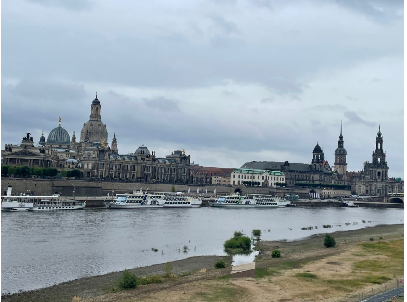
Blick auf Dresden