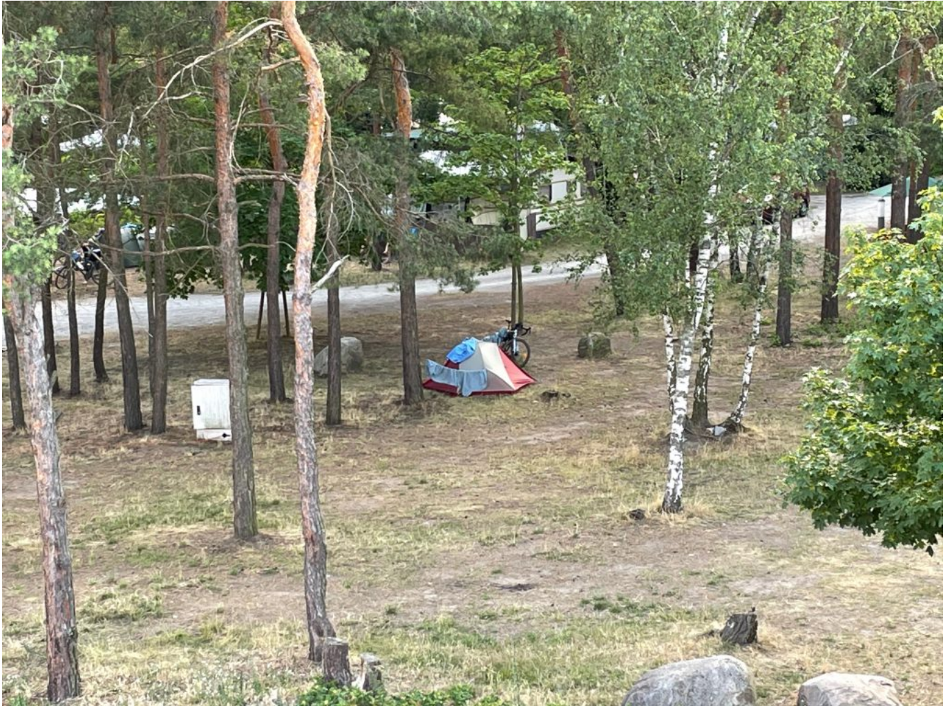
Blick auf meinen Zeltplatz