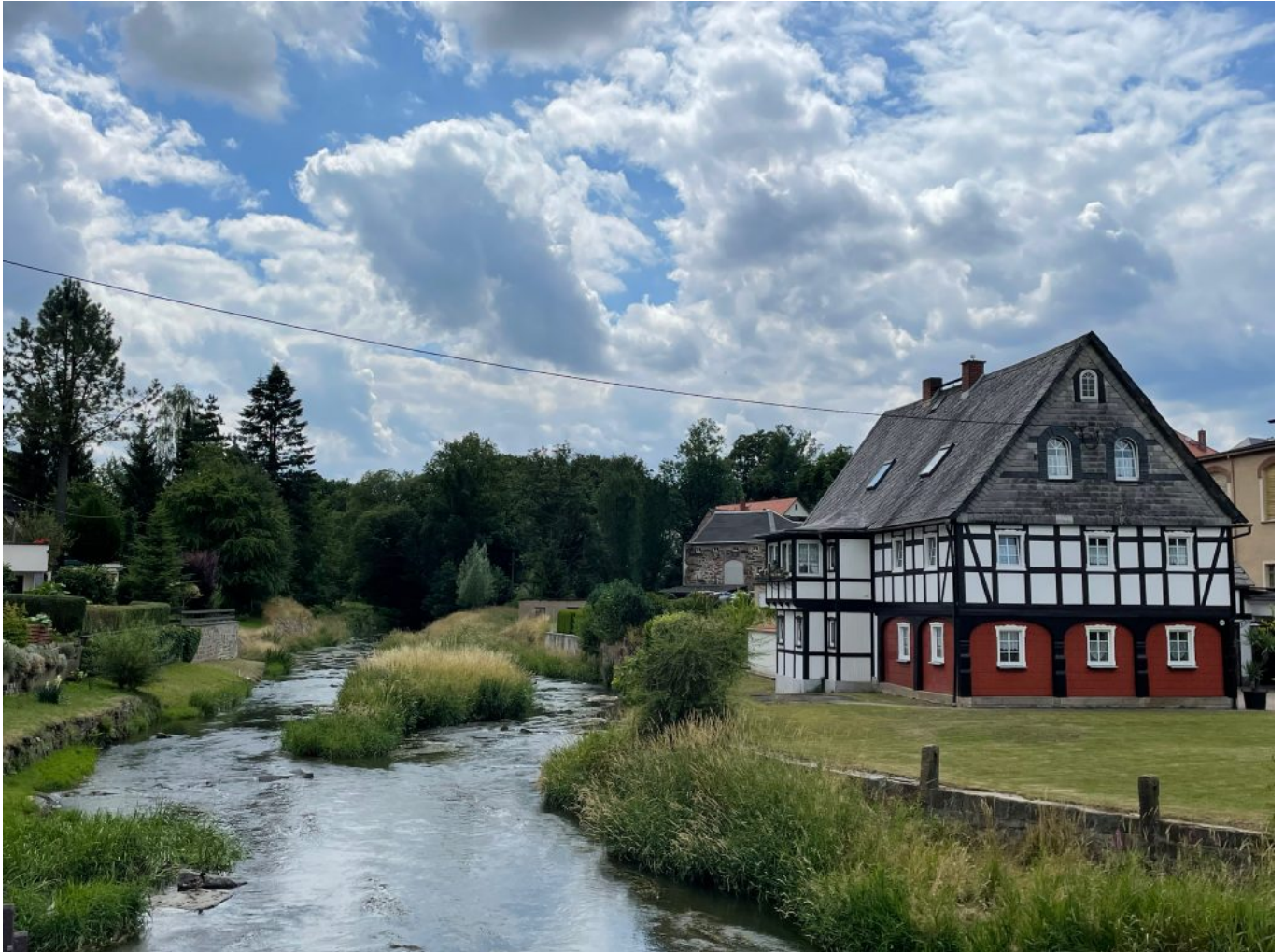
Idyllische Spree bei Schirgiswalde