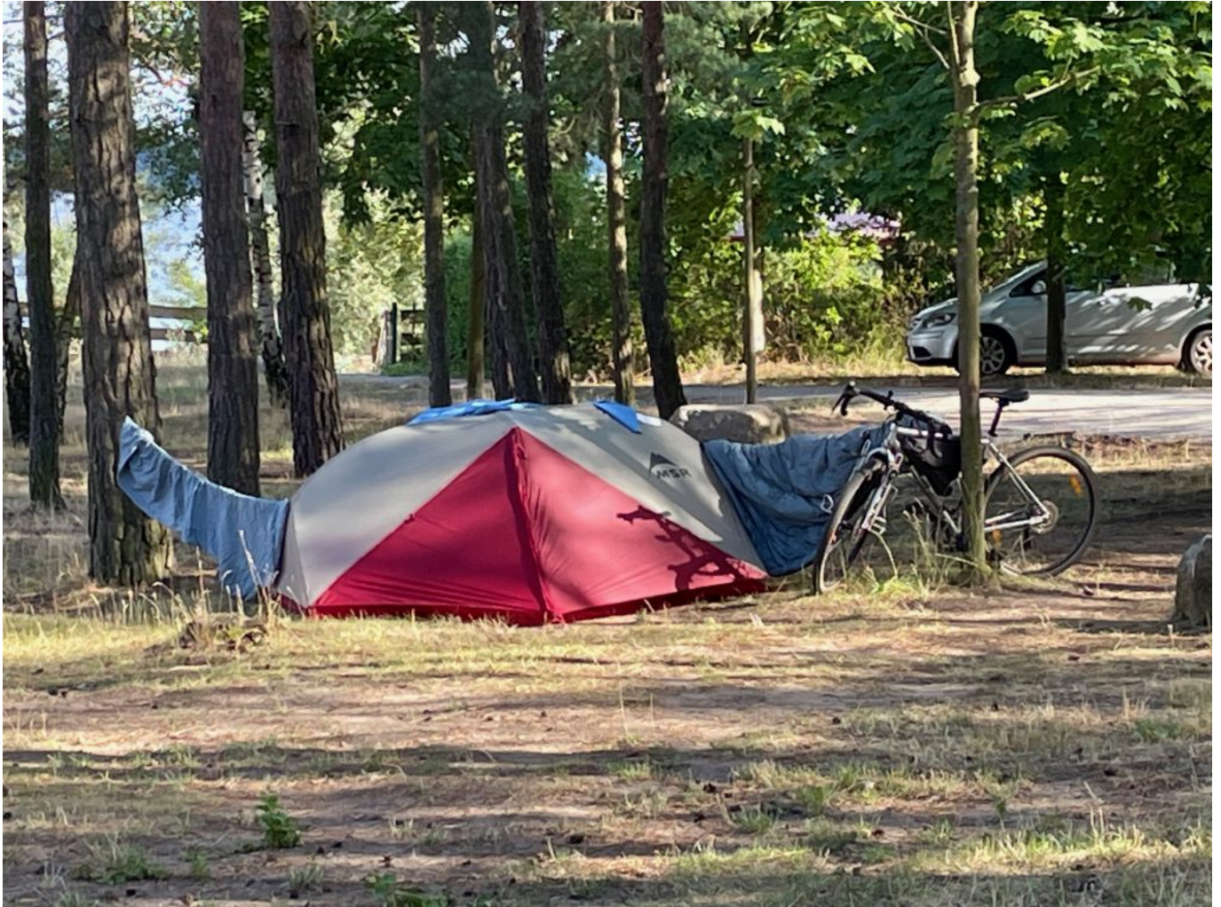
Das Zelt steht