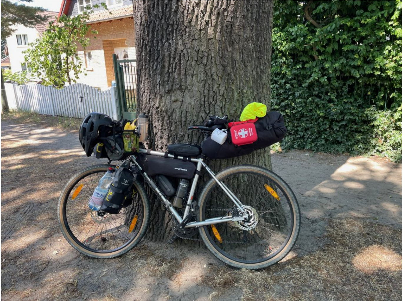
Kurze Pause im Schatten in Köpenick