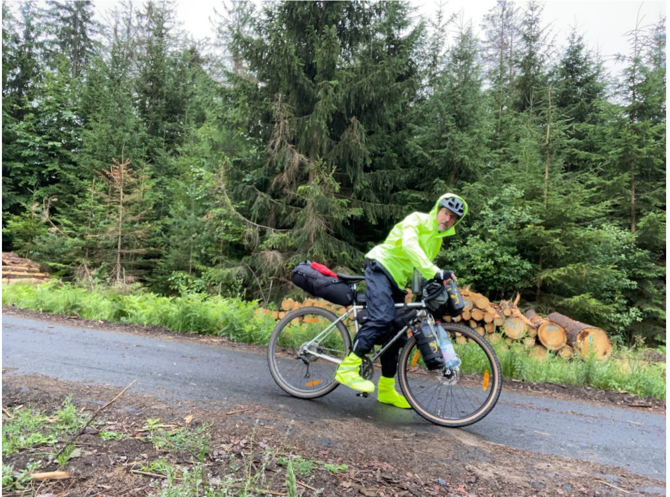
Die richtige Kleidung hilft ....

Nach 1,5 Stunden auf und ab erreichte ich dann die Grenze nach Deutschland. Mittlerweile war der Regen zum Glück nicht mehr dauerhaft und es tröpfelte nur noch ab und an. Jetzt ging es über Neustadt in Sachsen und Ehrenberg weiter. Kurzentschlossen änderte ich die Route etwas und machte einen Abstecher nach Hohnstein, obwohl das einiges an zusätzlicher Steigung und Höhenmeter mit sich brachte. Aber da ich schon vor Jahren einmal dort war, wollte ich die Chance nicht verpassen, nochmal vorbeizuschauen, wo ich schon in der Gegend war. Nachdem ich mich den langen Anstieg hochgekämpft hatte, gönnte ich mir erstmal einen Kaffee und ein großes Stück Kuchen im Café unterhalb der Burg.