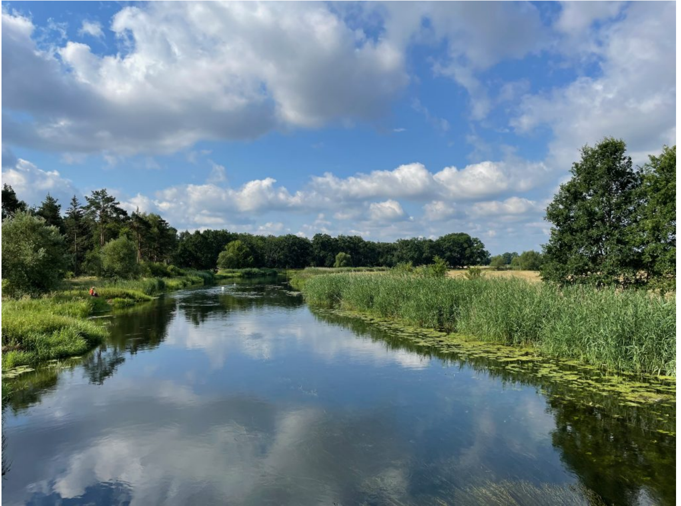
Die Spree in der Morgensonne