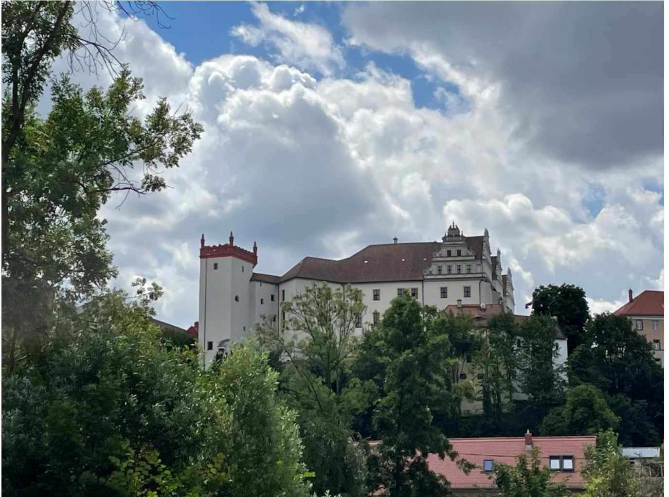
Blick auf die Ortenburg