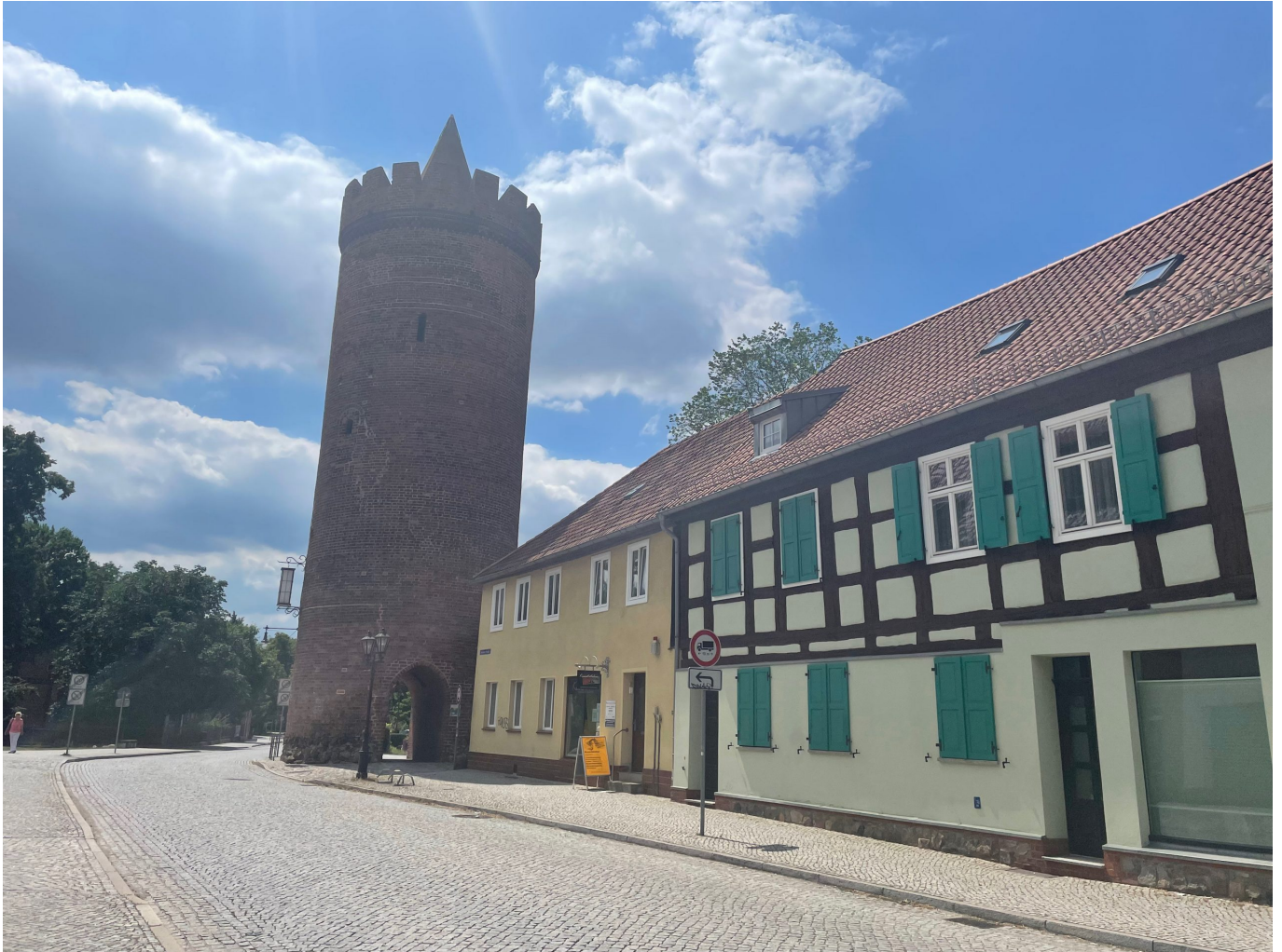
Altstadt von Beeskov