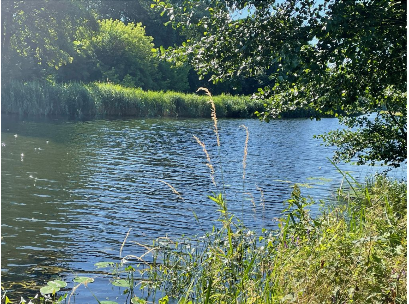
Immer am Wasser lang ...

In Liebenwalde verließ ich den Kanal und es ging in der drückenden Mittagshitze von mittlerweile irgendwo in den 30ern über Wandlitz in Richtung Berlin. Leider führte die Strecke jetzt hauptsächlich auf Radwegen an Landstraßen entlang, wo es zum Einen wenig Schatten gab und auch das Fahren nicht wirklich so viel Spaß machte. Die Durchquerung von Berlin lag mir schon vorher etwas quer, da ich ungern in Großstädten Rad fahre, aber sie ließ sich nicht ohne massive Umwege vermeiden. Die Strecke führte mich im Osten der Stadt durch Marzahn, zum Glück immer auf Radwegen, in Richtung Großer Müggelsee. Direkt vor Berlin waren auf Grund der Hitze auch meine Wasservorräte aufgebraucht und ich musste noch einen schnellen Stop an einer Tankstelle einlegen, da keine Supermärkte an der Strecke lagen.