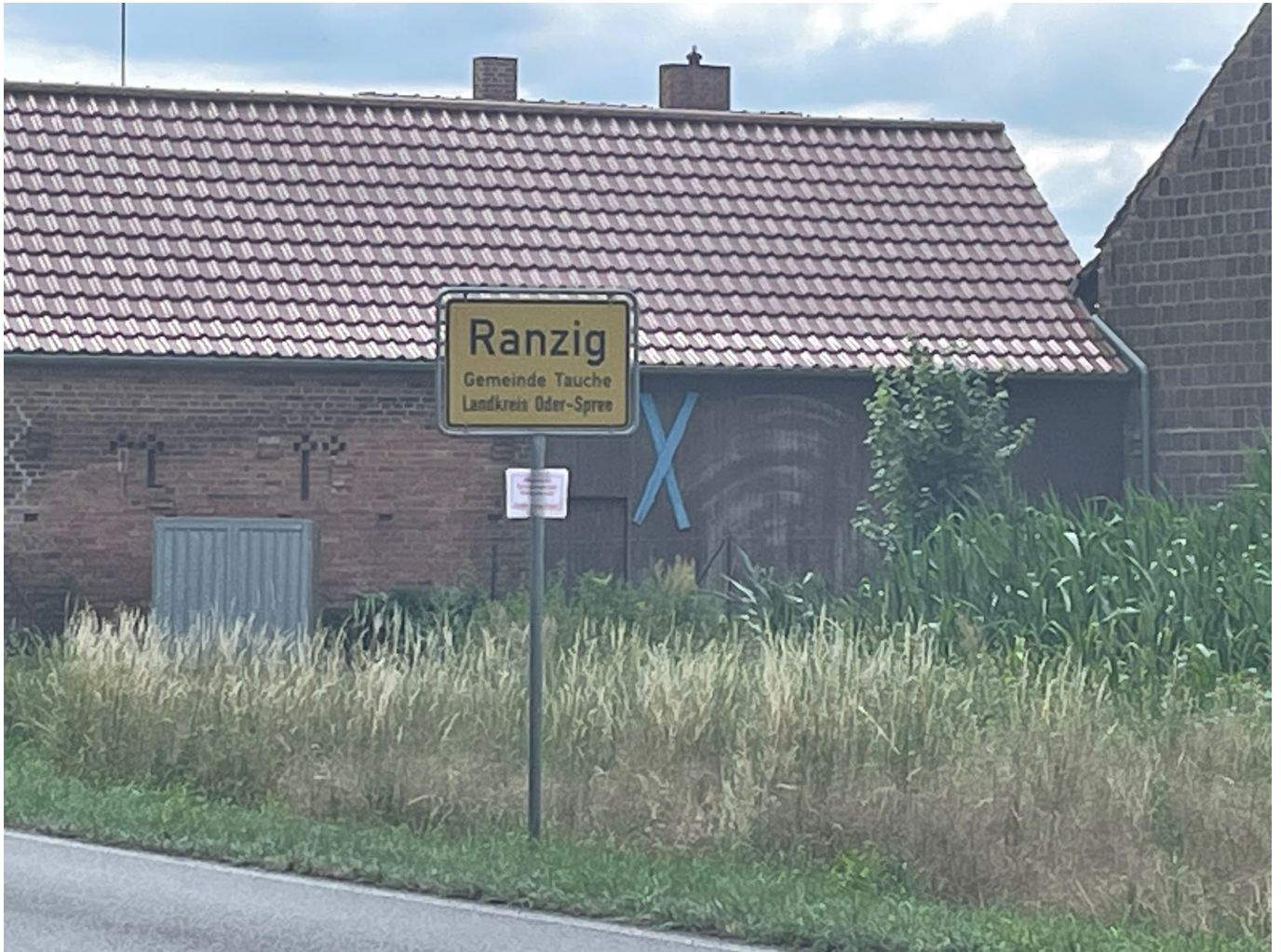
Sehr lustiger Ortsname