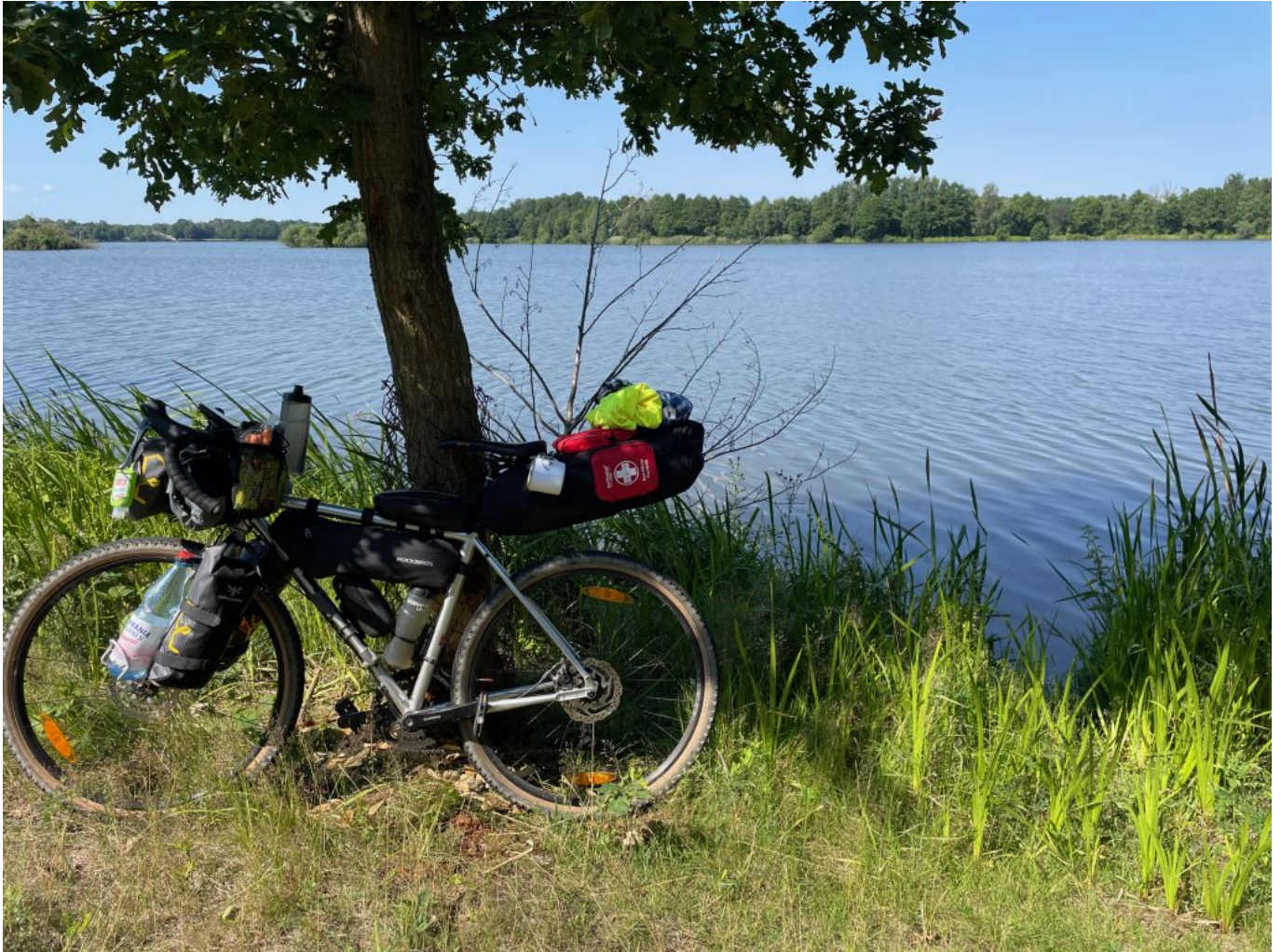
Kurze Pause am Inselteich