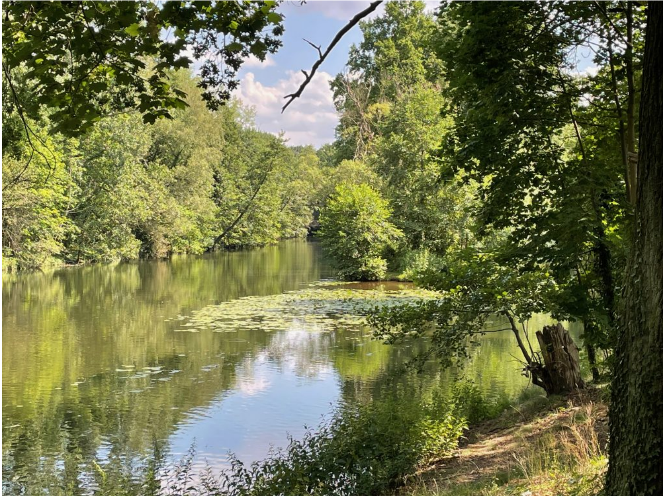
Die Spree in Cottbus