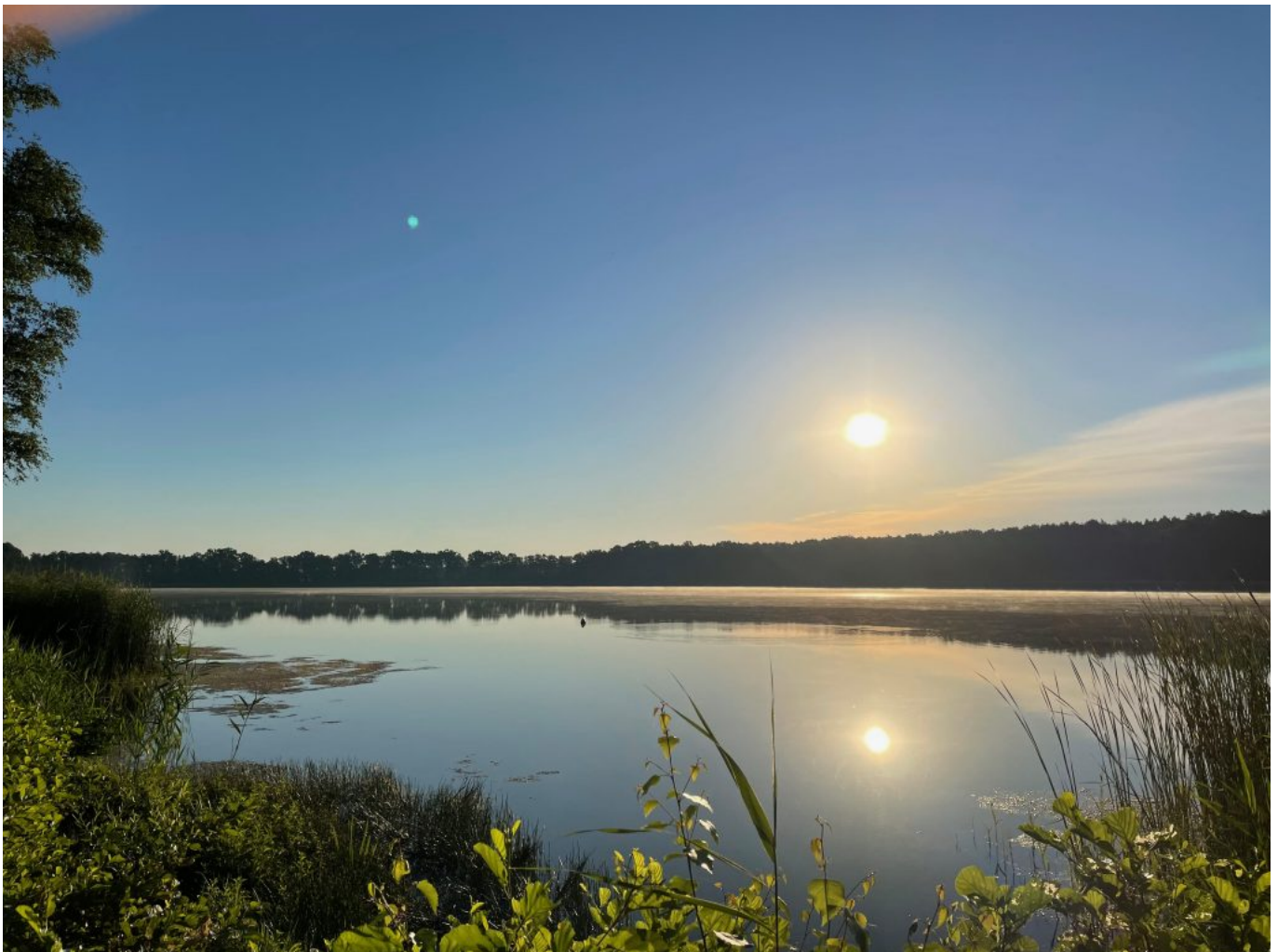
Ranziger See im Morgenlicht

Die Strecke führte anfangs entlang der Landstraße, bevor sie wieder auf den gut ausgebauten Radweg abbog. Es ging durch schöne Auen, Wiesen und lichte Kiefernwälder, zwar nicht direkt an der Spree entlang, aber immer wieder zurück zu dieser, bis zum Neuendorfer See und daran vorbei. Da ich es mir zur Gewohnheit gemacht hatte, mein Frühstück direkt bei einem Supermarkt oder, noch besser, einer Bäckerei zu holen, hatte ich morgens nur einen Haferriegel gegen den ersten Hunger gegessen und mir eine erste Tasse Kaffee gemacht, in der Hoffnung in einem der kleinen Dörfer an der Strecke eine Bäckerei zu finden. Leider zeigte es sich im Verlauf des Morgens, dass dies ein Trugschluss war. Also stoppte ich nach einiger Zeit und bemühte Googlemaps um die nächste Bäckerei irgendwo im Umkreis zu finden ... und siehe da, es gab tatsächlich ein Café nicht allzuweit ab von meiner Route. So kam ich dann endlich nach 1:45h und 38 Kilometern endlich zu meinem Frühstück und einem ordentlichen Milchkaffee.