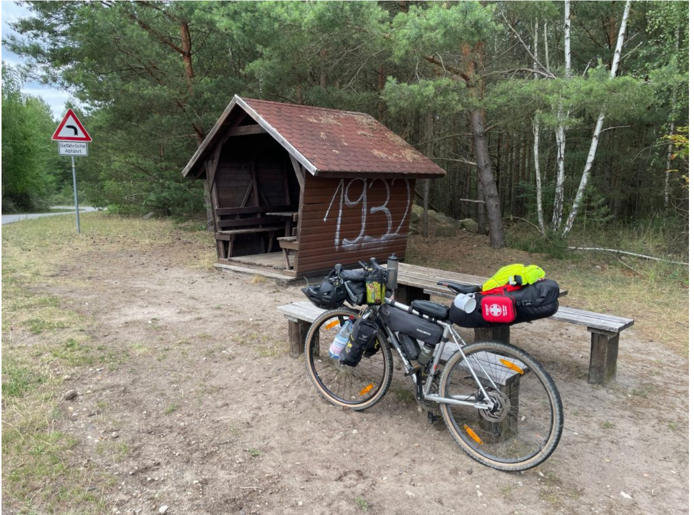
Pause oberhalb des Bärwalder Sees