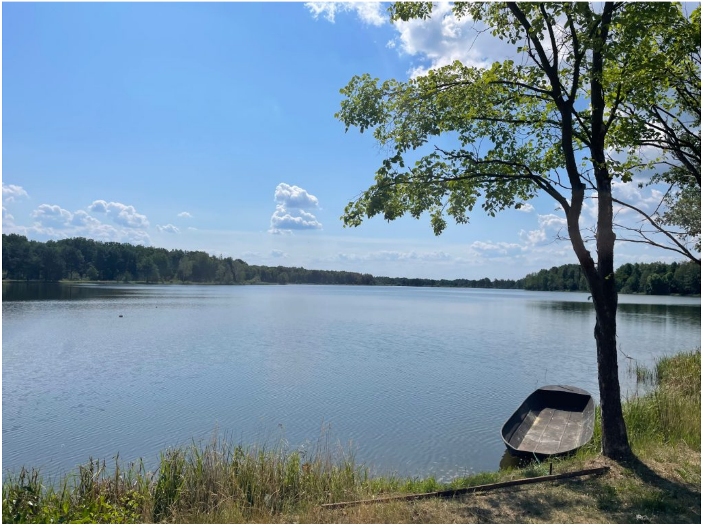
Fast wie gemalt