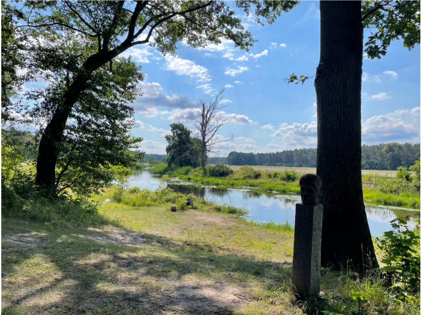
Immer am Fluß entlang