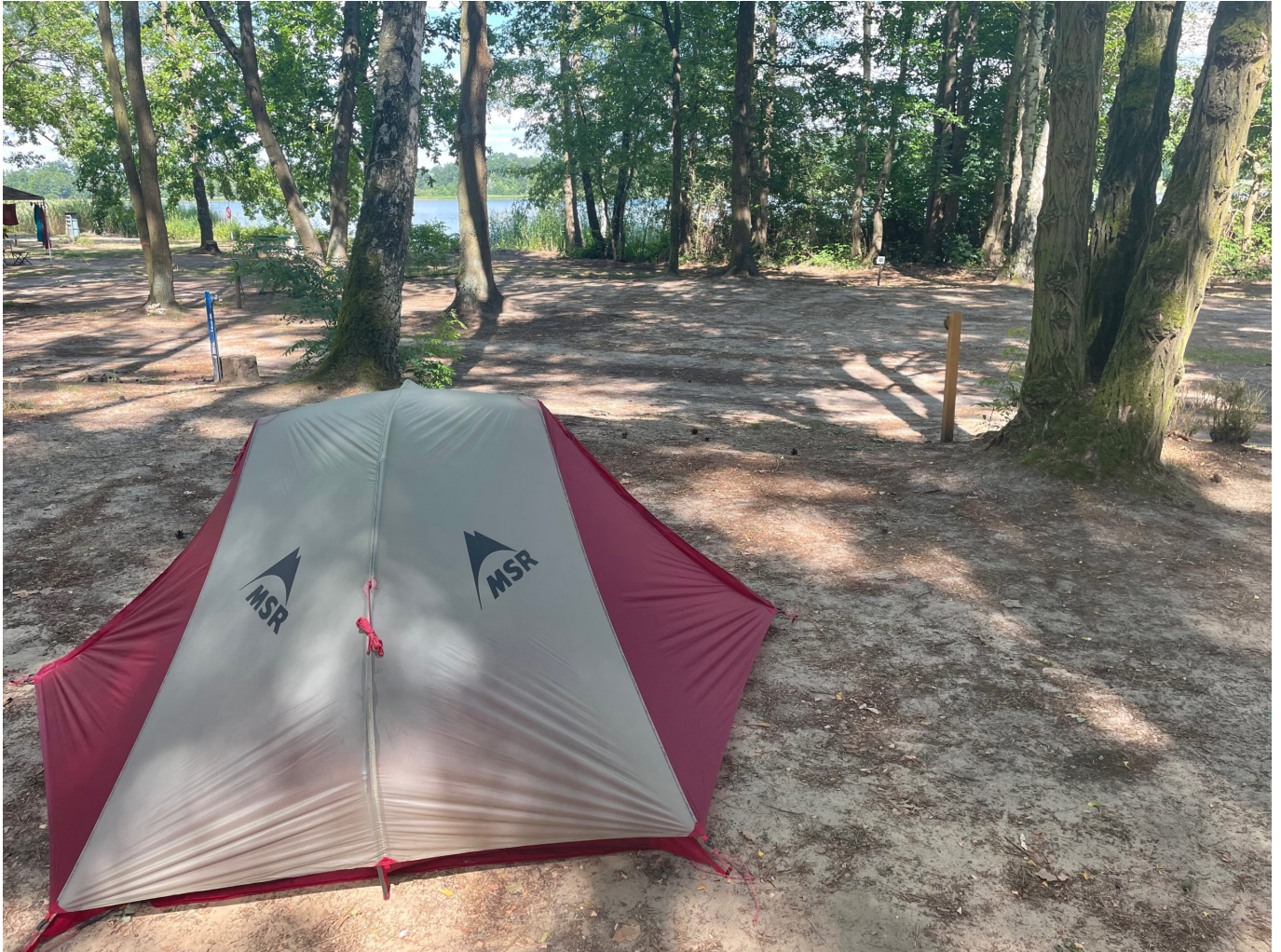
Camping am Ranziger See