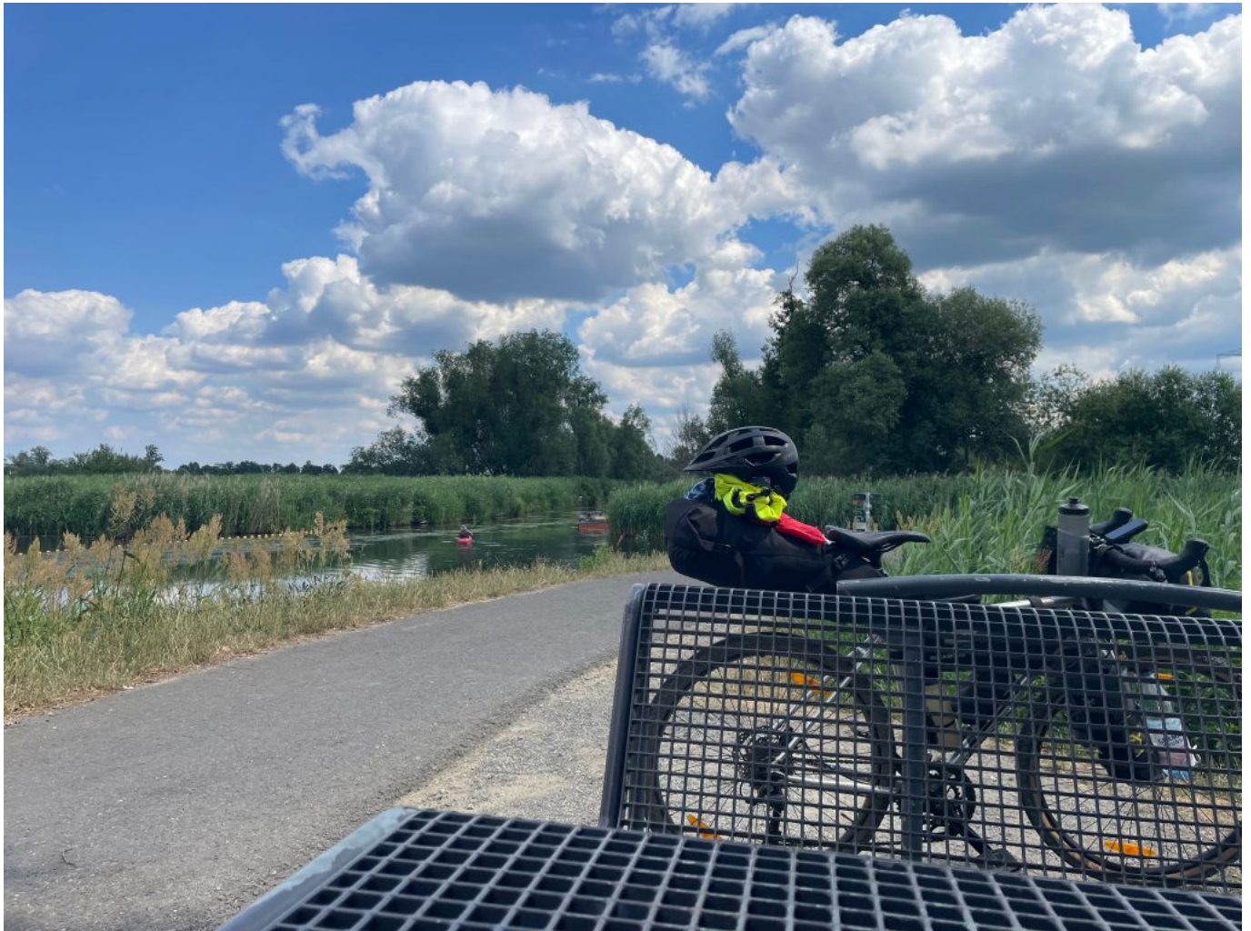
Mittagspause hinter Lübben