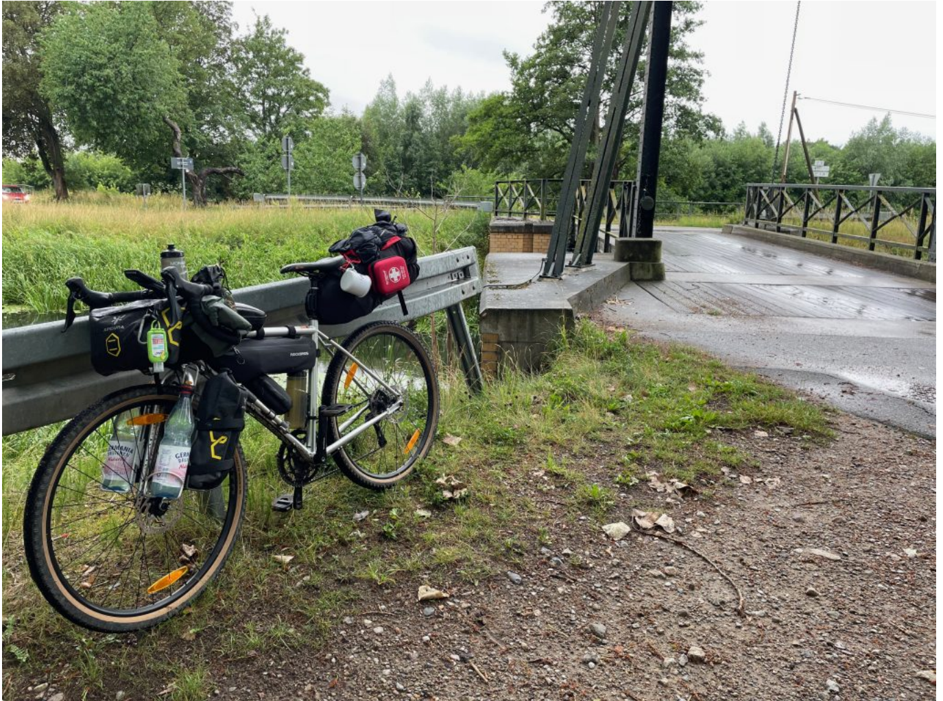
Erste Pause nach 30km