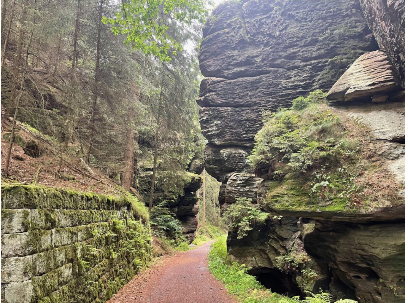
Die magisch-mythischen Reingrund und Zscherregrund beeindrucken durch ihre Wälder und Felsenformationen

Nachdem ich die Magie der Sächsischen Schweiz hinter mir gelassen hatte, stieß ich bei Stadt Wehlen auf die Elbe und den Elberadweg. Jetzt lagen noch etwas über 30 km auf gerader, flacher Strecke vor mir und ich war froh wieder etwas Tempo machen zu können. Der gut ausgebaute Radweg führte meist am Wasser entlang und es ging flott vorbei an Pirna und schon bald konnte ich das Elb-Florenz in der Ferne sehen. Die Einfahrt nach Dresden wurde wieder durch Regenschauer begleitet, teils so stark, dass ich mich unterstellen musste. Da ich noch einige Zeit hatte, bis ich mein AirBnB-Apartment beziehen konnte, rollte ich gemütlich Richtung Innenstadt und gönnte mir dann zum Abschluss der Tour einen ordentlichen Döner. Kurz danach konnte ich dann in das Apartment direkt in der Innenstadt und ausgiebig heiß duschen und mein Zelt zum trocknen aufhängen. Erfrischt