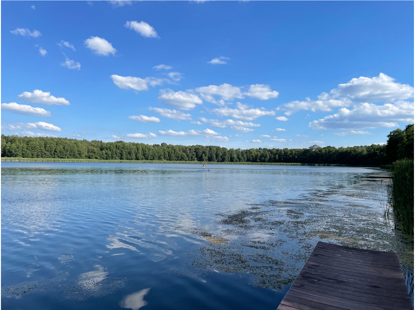
Abendstimmung am See