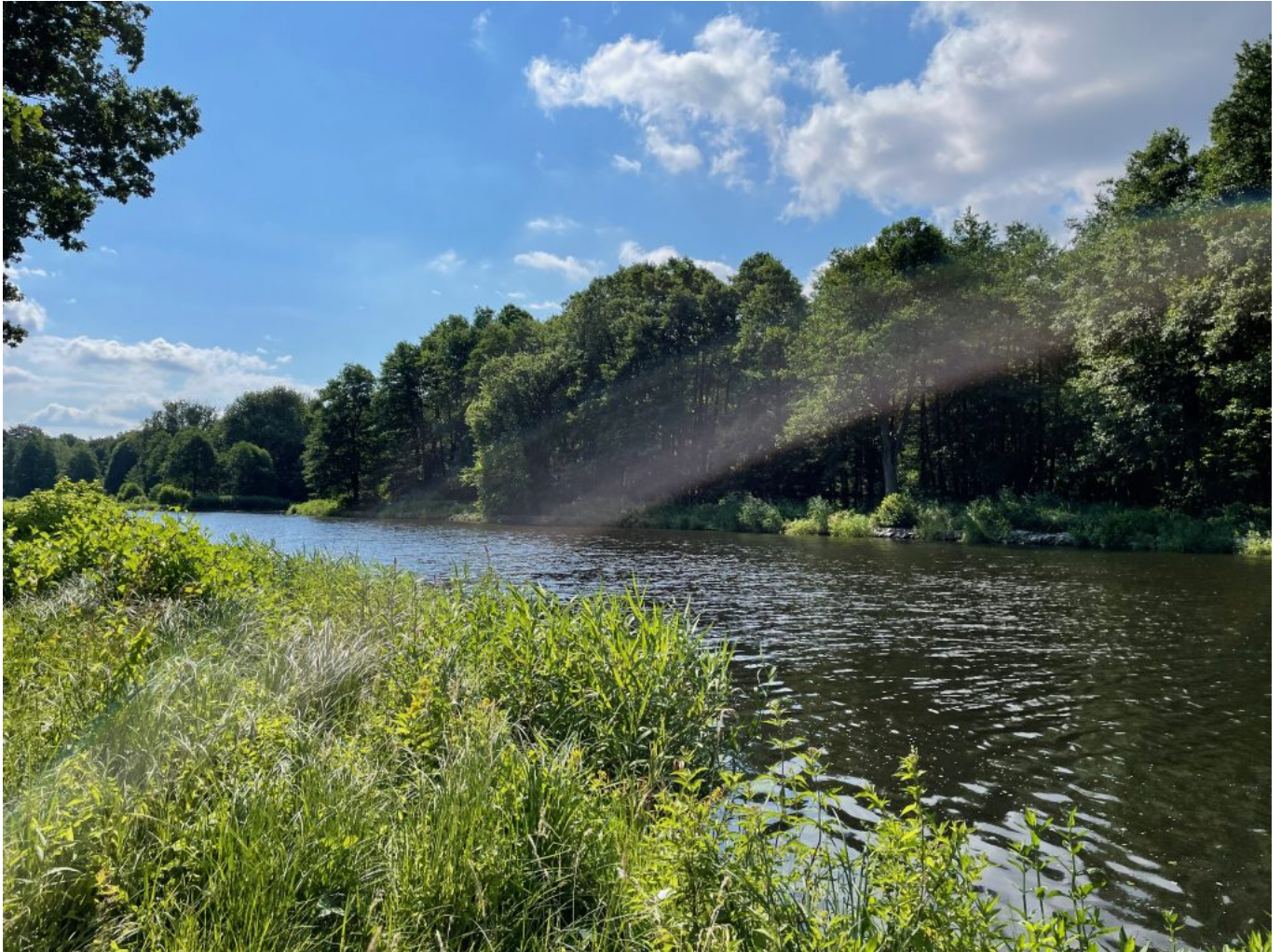
... und immer wieder ans Wasser