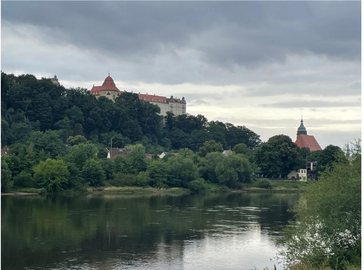
Blick auf Pirna