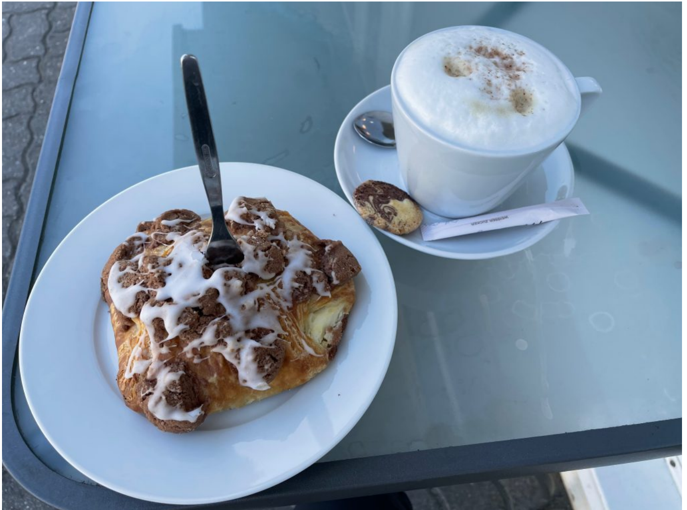
Endlich Frühstück !!!