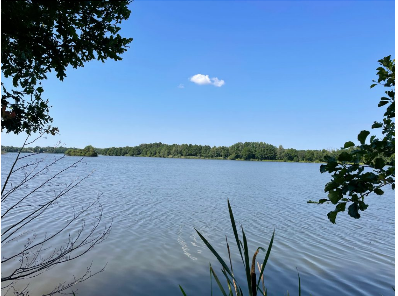
Blick auf den Sommerteich