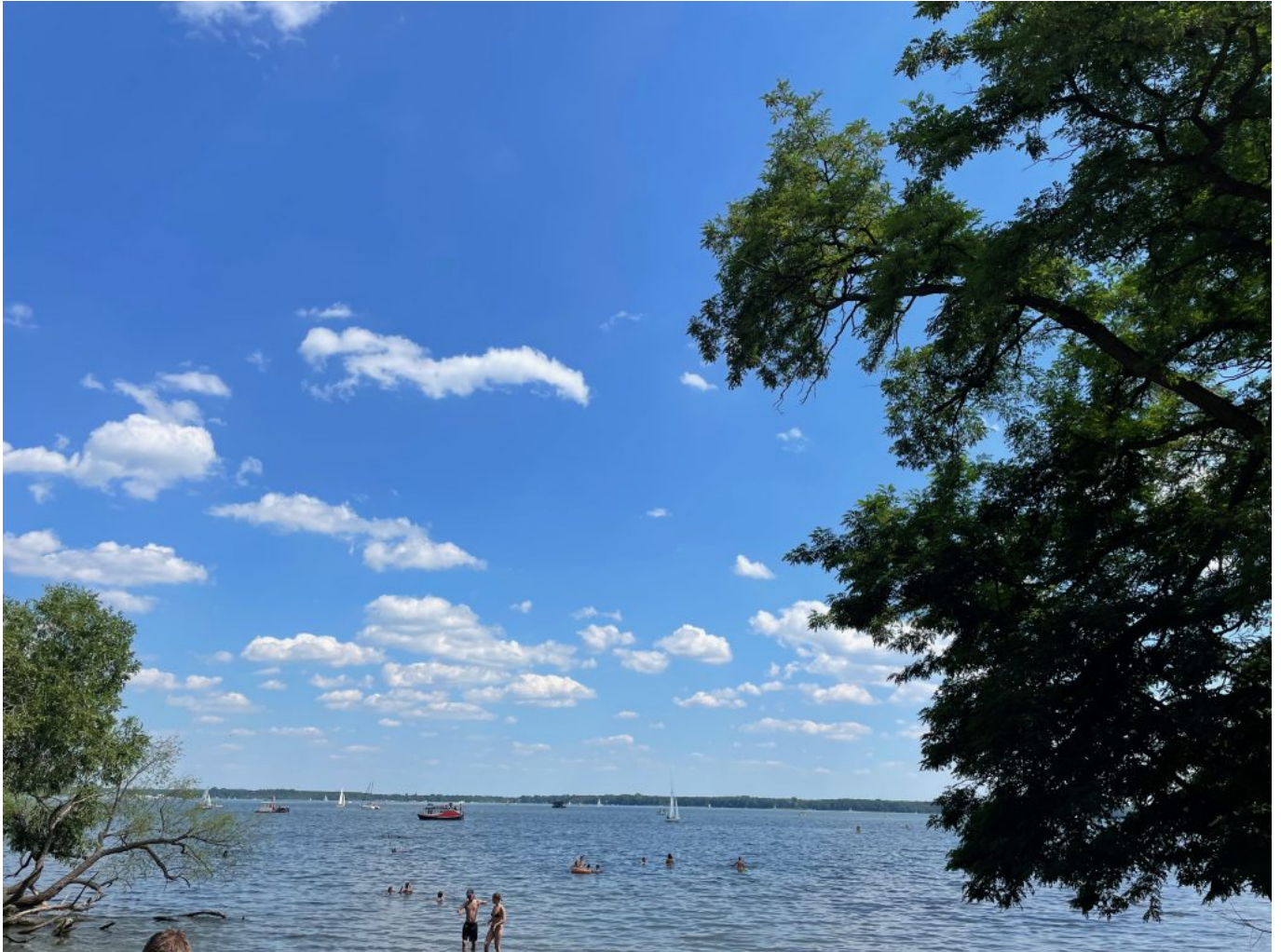
Am Großen Müggelsee