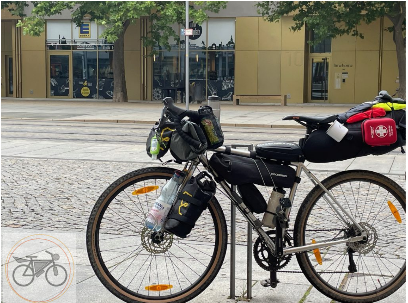
Letzte Pause beim Döner