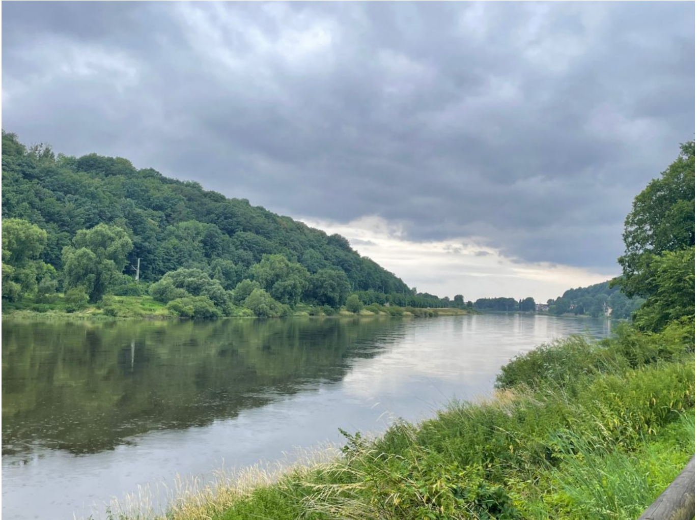
immer am Wasser entlang