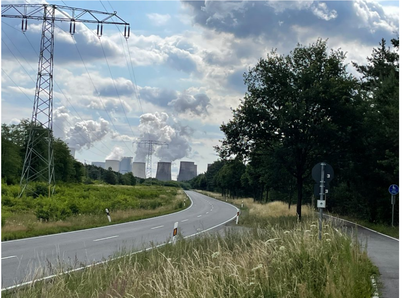
Blick auf das Kraftwerk Boxberg